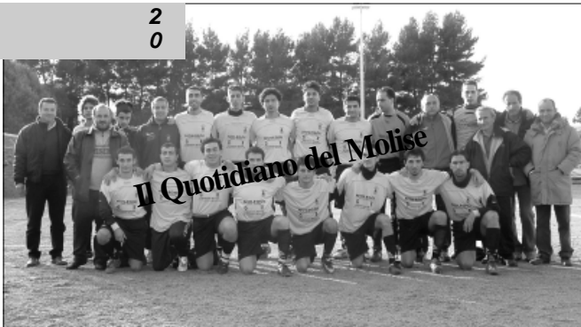
Il Mafalda al gran completo