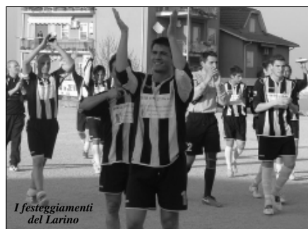
I festeggiamenti del Larino