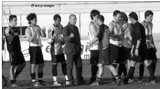
Il terzo tempo