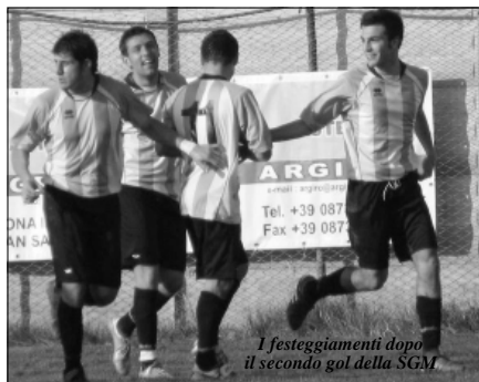
I festeggiamenti dopo il secondo gol della SGM